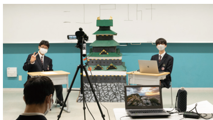
▲芝雄会で購入した機材は、生徒の収録や配信にも活用(写真は2年D組)。