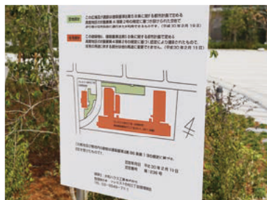
◀記念碑はマンション敷地の入口に設置されているため、公道からご覧いただけます。