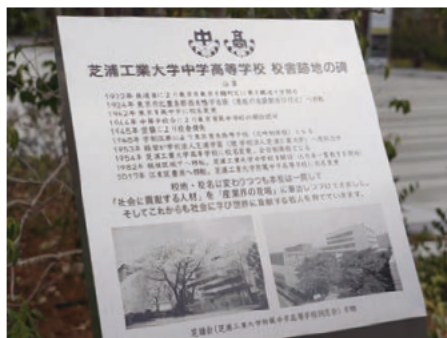
◀記念碑には学校の沿革、板橋校舎と桜の写真が記されています。