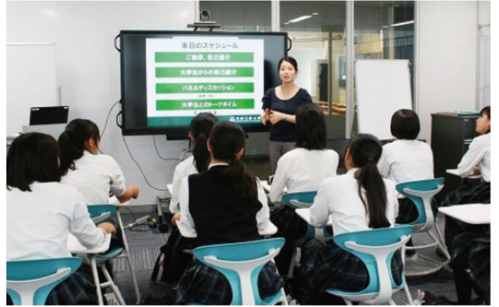
授業を受ける女子生徒（高校）。2020年3月には新豊洲校舎で最初の女子生徒が卒業する。

2021年4月より中学入学生も共学にすることに決定しました。芝浦は中学・高校・大学と一貫して理工系人材を育成できる唯一の学園です。グローバルズムとダイバーシティがこれだけ進む世の中で、「工業＝男子」という枠組みはすでに意味をなさなくなっています。中学共学化はタイミングの問題でした。高校共学化に5年遅れたのは、女子生徒への生活指導法や女性教員数の問題など学校側の準備ができていなかったことが主な理由です。