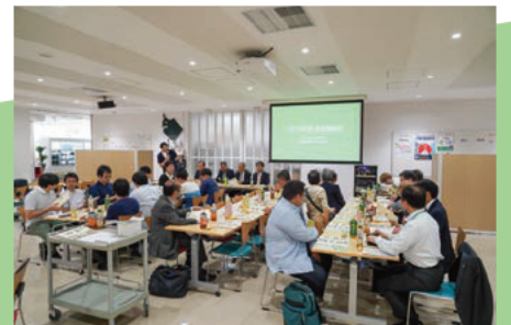
2019年度の様子。 会場は1階カフェテリア。