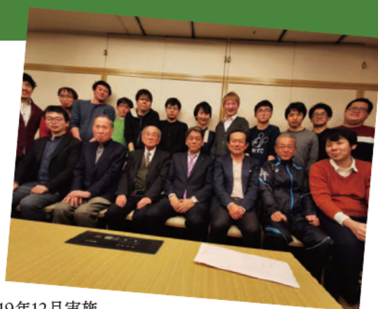
2019年12月実施 常任幹事会兼同期会の様子

申請いただくと、15名以上の出席で一律3万円の補助をはじめ、芝雄会ホームページやSNSでの告知や、招待状の送付をお手伝いします。